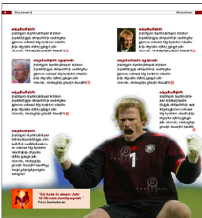
Muster Innenseiten deutsche Version

Die Preise in Euro gelten jeweils für eine Version. Zuzüglich MwSt. Lieferung frei München.