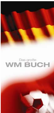
Muster Titelseite Deutsche Version

Inhalt: mind. 40 Seiten rund um die WM 2006 (Karte mit den Spielorten und Spielterminen, wie kam die WM nach Deutschland, Beckenbauer-Story, die deutsche Mannschaft, die Mannschaften 2006, Rückblick und anderes mehr) mind. 80 Seiten über die WM-Städte und die WM-Stadien (2-6 Seiten je Stadt, 2-4 Seiten je Stadion und je 2 Seiten Stadtplan mit weiteren Tipps)